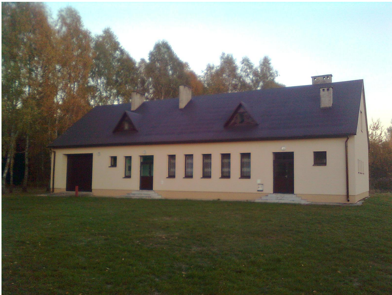
Dom Ludowy w Rydzowie